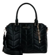
GS26019-3 Pag. 55 $1,299