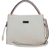
MD25146-E Pag. 42 $599