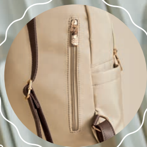
BOLSILLO TRASERO CON CIERRE MD25157-8 / $699