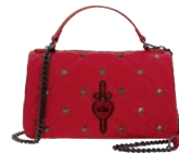
VI26001-R Pag. 129 $1,299