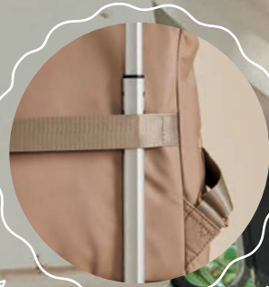
BANDA PARA BASTÓN DE MALETA MD25165-8 / $999