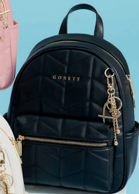
GS26018-3 / $1,299