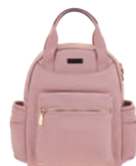
MD25166-P Pag. 8 $999