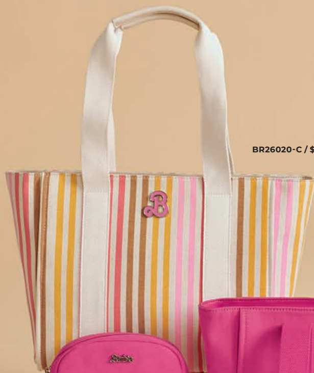
BR26020-C / $1,499