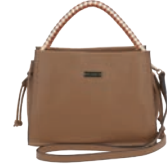
MD25146-B Pag. 42 $599