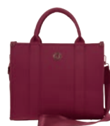
MD26025-M Pag. 40 $799