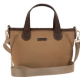
MD25193-B Pag. 31 $499