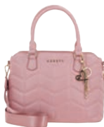
GS26019-P Pag. 55 $1,299