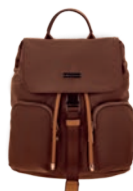
MD25165-B Pag. 9 $999