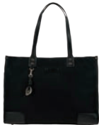
GS26005-3 Pag. 49 $1,399