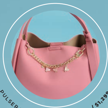
PULSERA REMOVIBLE GS26011-P / $1,299