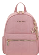
GS26018-P Pag. 54 $1,299