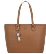
PR26001-B Pag. 121 $1,599