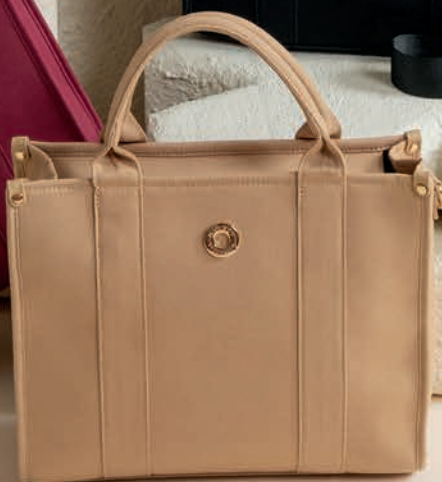
MD26025-E / $799