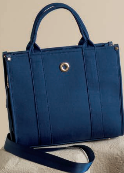
MD26025-9 / $799