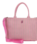
BR26016-P Pag. 96 $1,499