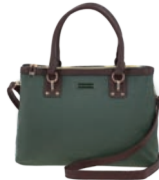
MD25186-2 Pag. 24 $599