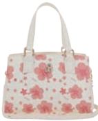
BR26014-W Pag. 95 $1,299