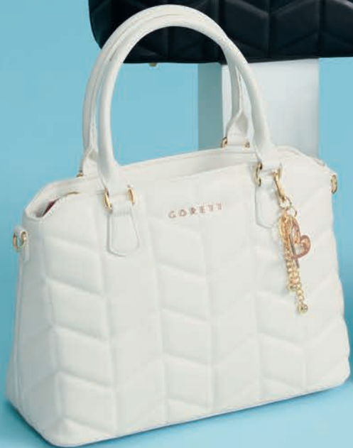
GS26019-W / $1,299