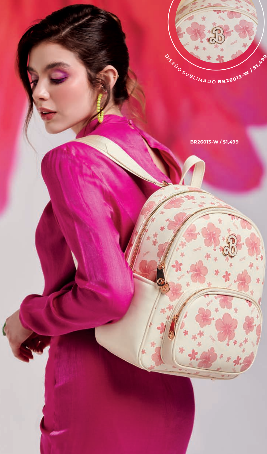
BR26013-W / $1,499