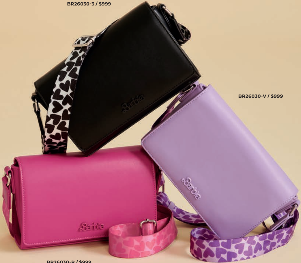
BR26030-P / $999