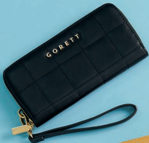
GS26023-3 / $599