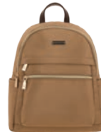
MD25157-B Pag. 21 $699