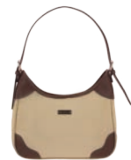
MD25189-8 Pag. 34 $499