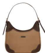
MD25189-B Pag. 34 $499