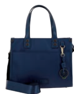
GS26009-9 Pag. 65 $999