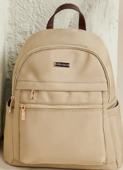
MD25157-8 / $699