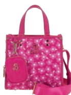
BR26035-P Pag. 109 $1,299