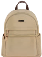
MD25157-8 Pag. 22 $699