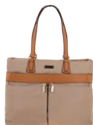
MD25167-8 Pag. 7 $899