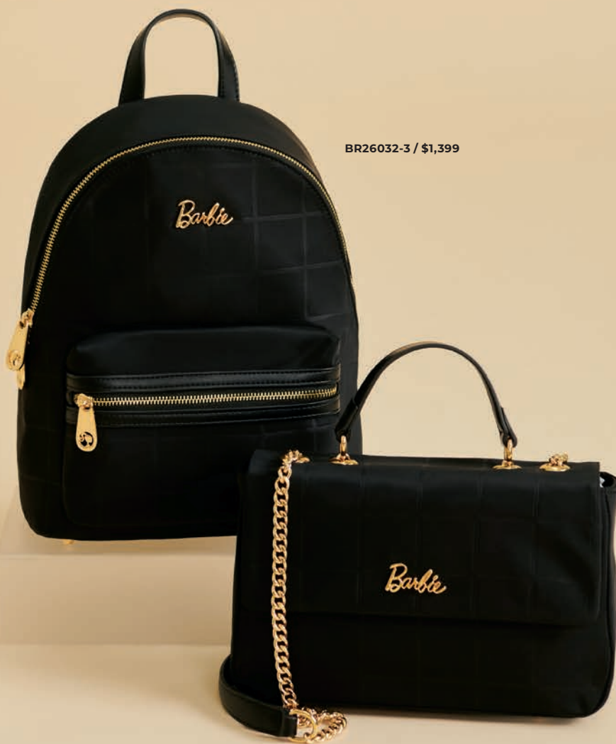
BR26032-3 / $1,399