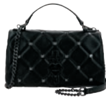
VI26001-3 Pag. 129 $1,299