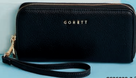
GS26028-3 / $599