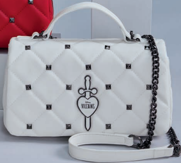
VI26001-W / $1,299