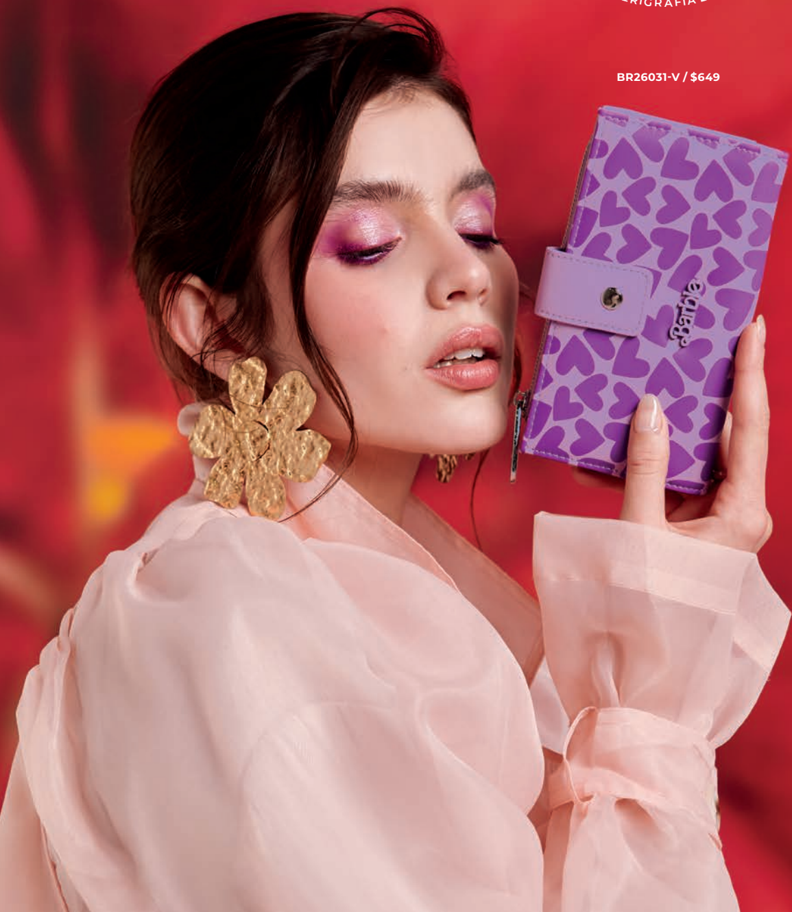
BR26031-V / $649