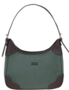
MD25189-2 Pag. 34 $499