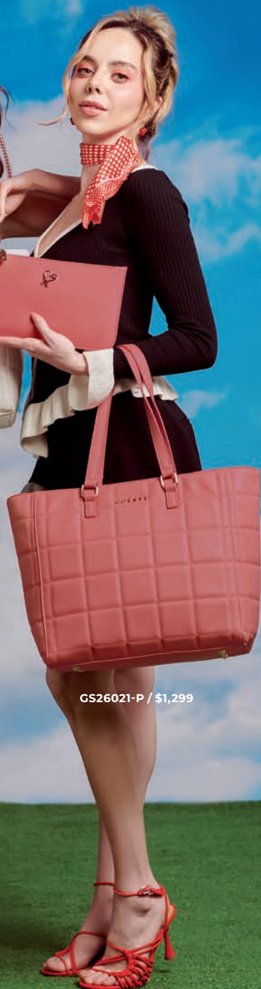
GS26021-P / $1,299