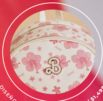
DISEÑO SUBLIMADO BR26013-W / $1,499