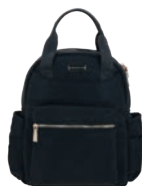
MD25166-3 Pag. 8 $999