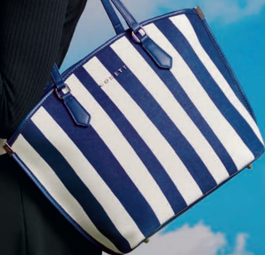
GS26016-9 / $1,199