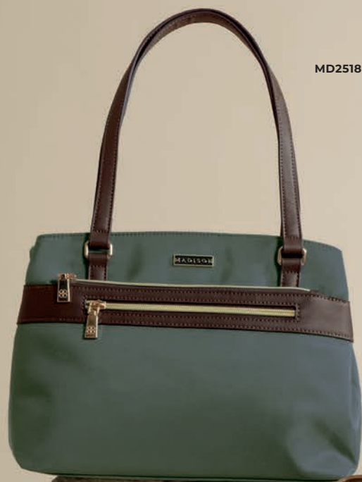
MD25188-2 / $599