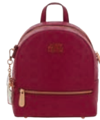
PR26002-M Pag. 121 $1,299