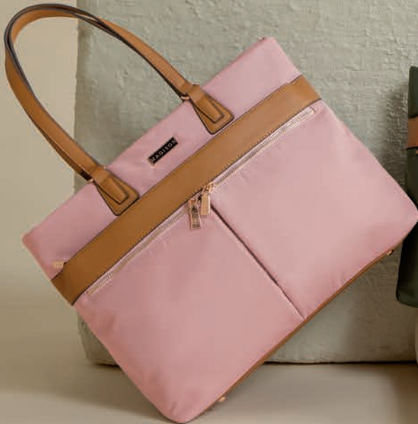
MD25167-P / $899