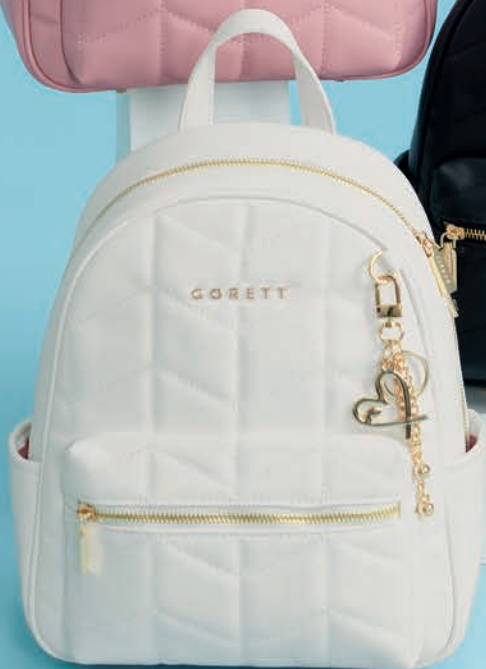
GS26018-W / $1,299