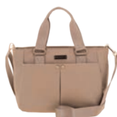
MD25169-8 Pag. 13 $699