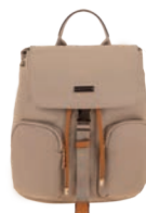
MD25165-8 Pag. 10 $999