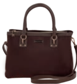
MD25186-D Pag. 25 $599