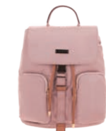
MD25165-P Pag. 10 $999