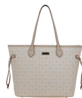
MD25148-E Pag. 18 $699