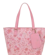
GS26031-P Pag. 57 $1,399