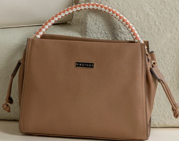
MD25146-B / $599