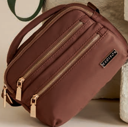
MD25180-B / $499