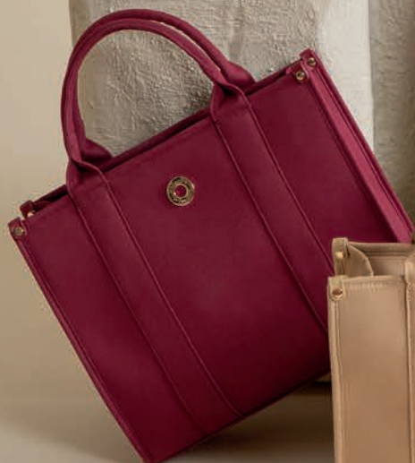
MD26025-M / $799