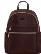
MD25157-D Pag. 22 $699