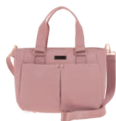
MD25169-P Pag. 13 $699