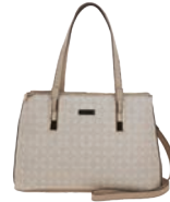
MD25149-E Pag. 20 $799