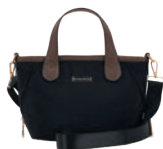
MD25193-3 Pag. 31 $499