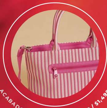
ACABADO BORDADO BR26016-P / $1,499