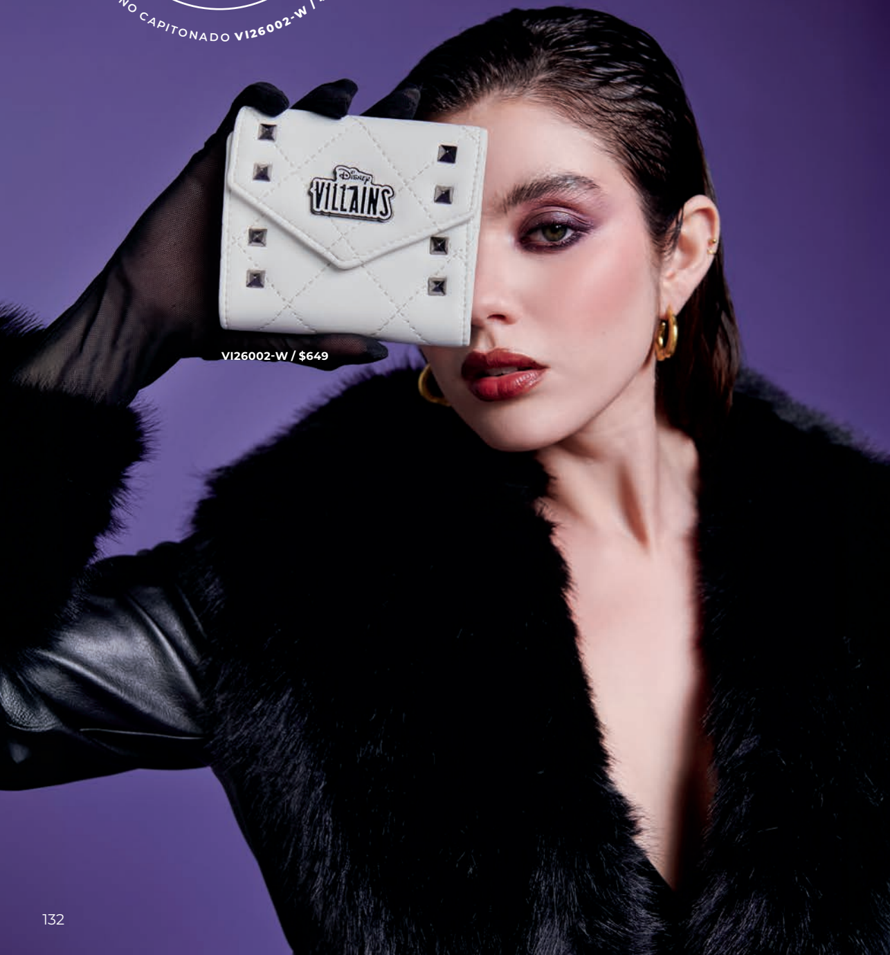
VI26002-W / $649