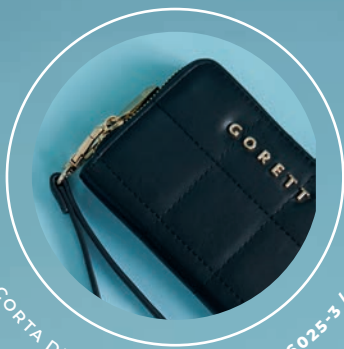
ASA CORTA DE MANO OPCIONAL GS26025-3 / $549