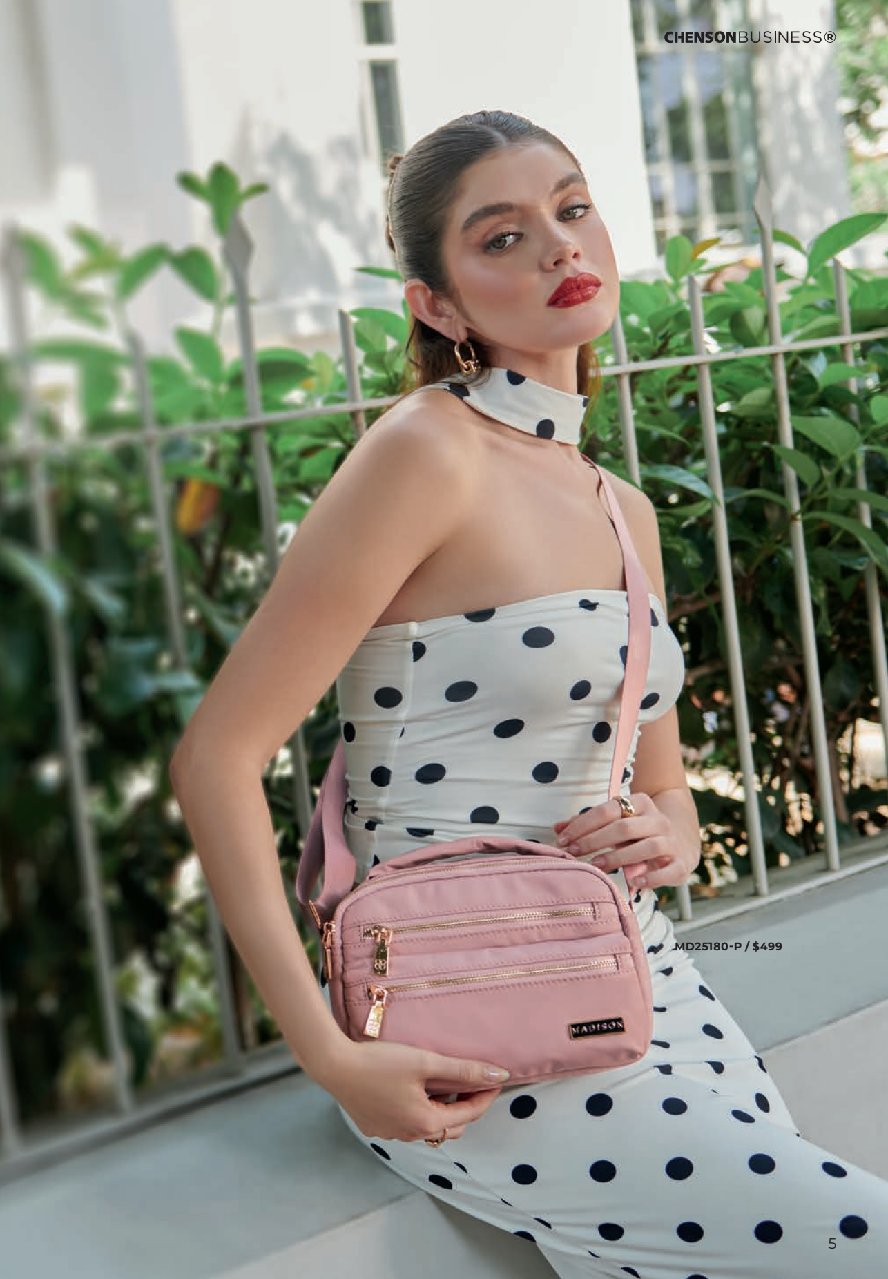
MD25180-P / $499