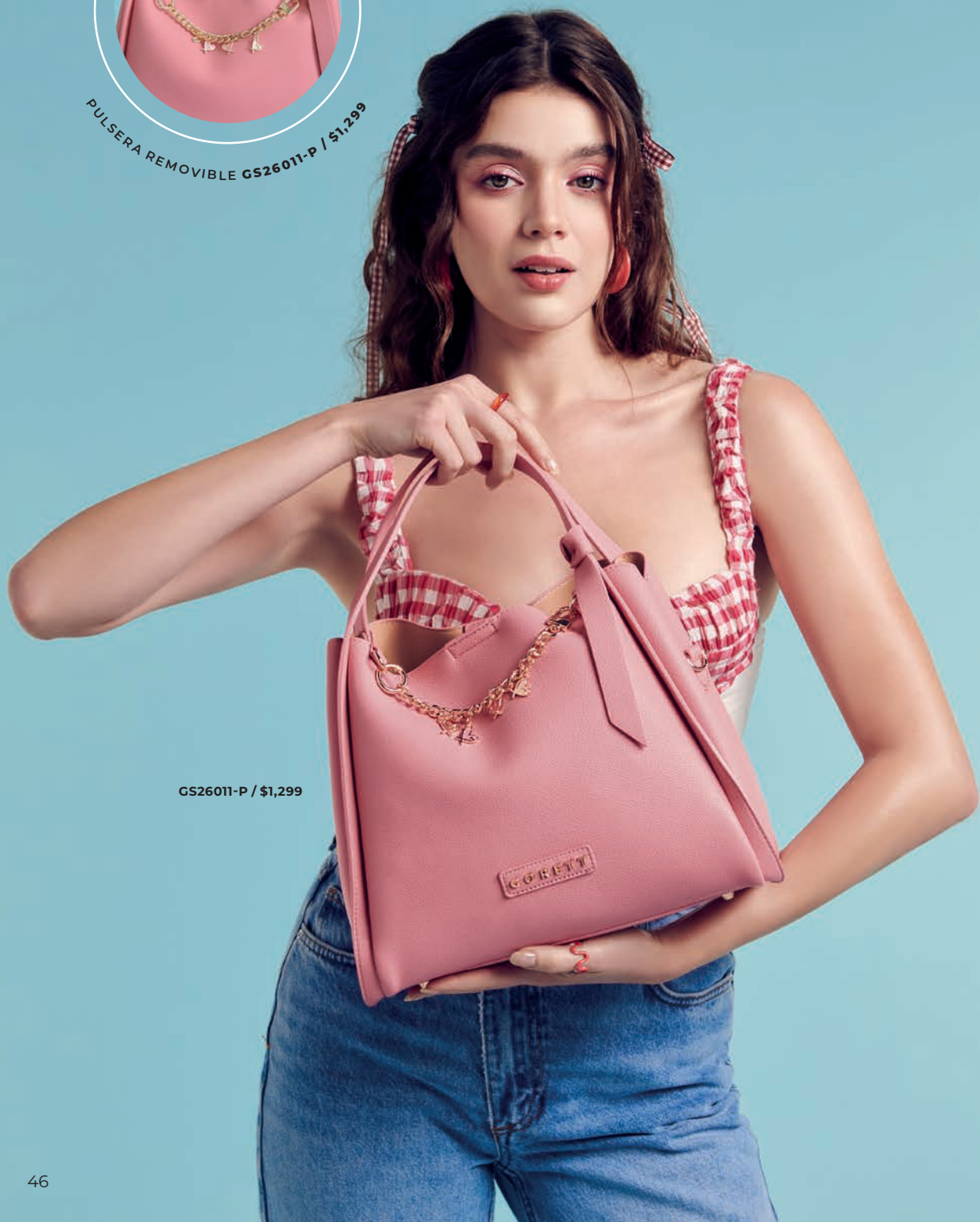
GS26011-P / $1,299