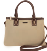
MD25186-8 Pag. 25 $599