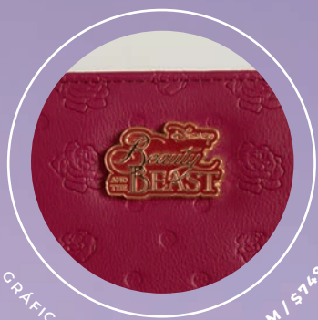
GRÁFICO EMBOSADO PR26003-M / $749