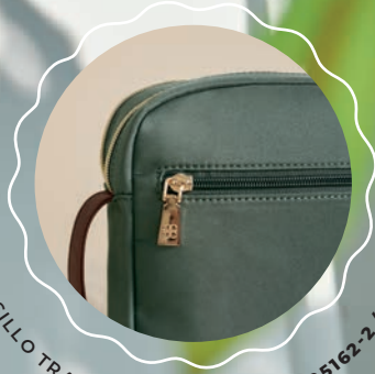
BOLSILLO TRASERO CON CIERRE MD25162-2 / $449