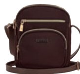
MD25162-D Pag. 38 $449