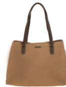
MD25187-B Pag. 26 $599