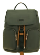
MD25165-A Pag. 9 $999