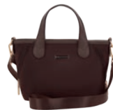
MD25193-D Pag. 32 $499