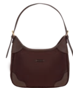
MD25189-D Pag. 34 $499