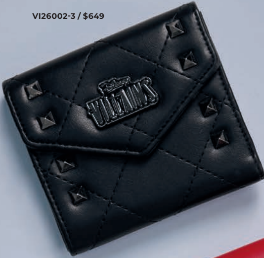
VI26002-3 / $649