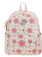
BR26013-W Pag. 95 $1,499