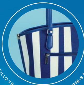
BOLSILLO TRASERO CON CIERRE GS26016-9 / $1,199