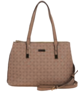
MD25149-P Pag. 20 $799