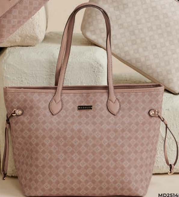
MD25148-P / $699