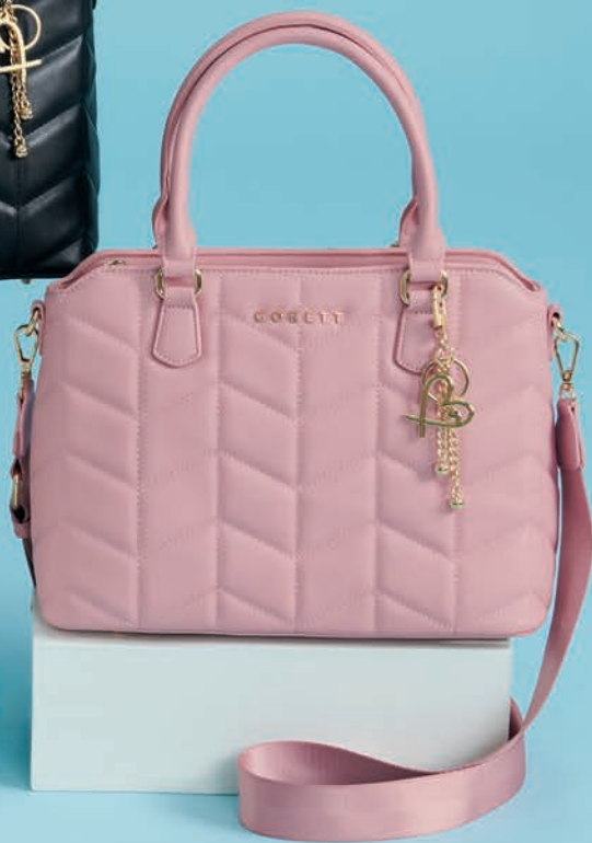
GS26019-P / $1,299