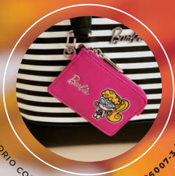
ACCESORIO COLGANTE REMOVIBLE BR26007-3 / $1,299