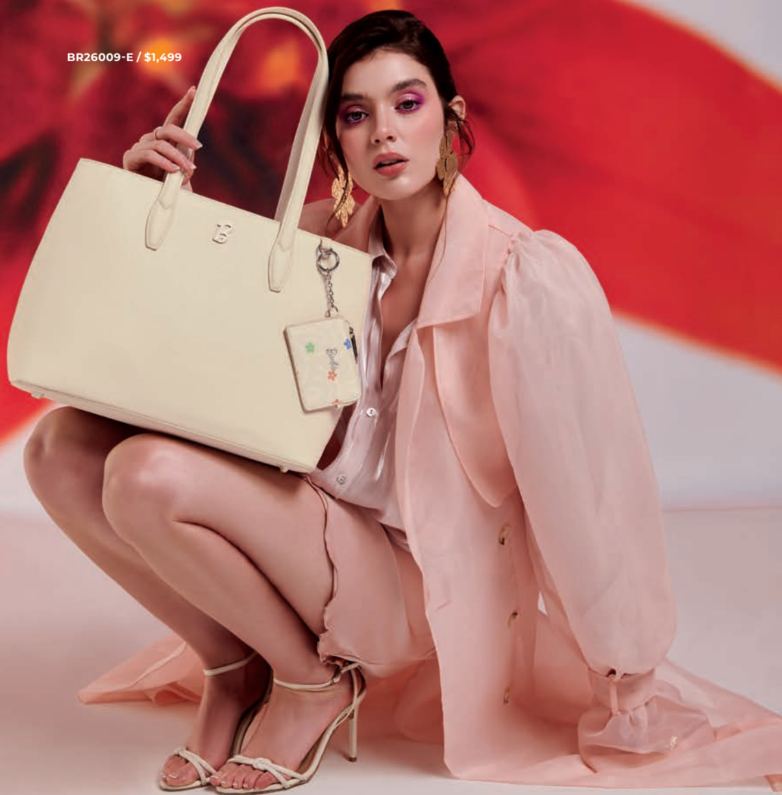
BR26009-E / $1,499