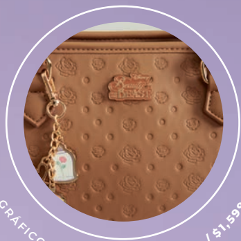
GRÁFICO EMBOSADO PR26001-B / $1,599