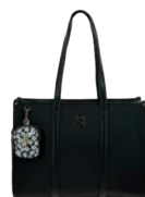
BR26034-3 Pag. 109 $1,499