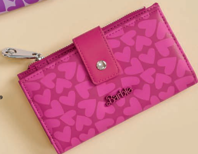
BR26031-P / $649