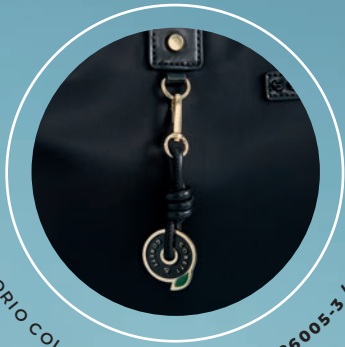
ACCESORIO COLGANTE REMOVIBLE GS26005-3 / $1,399