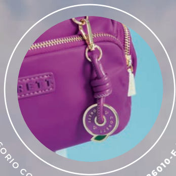
ACCESORIO COLGANTE REMOVIBLE GS26010-F / $899