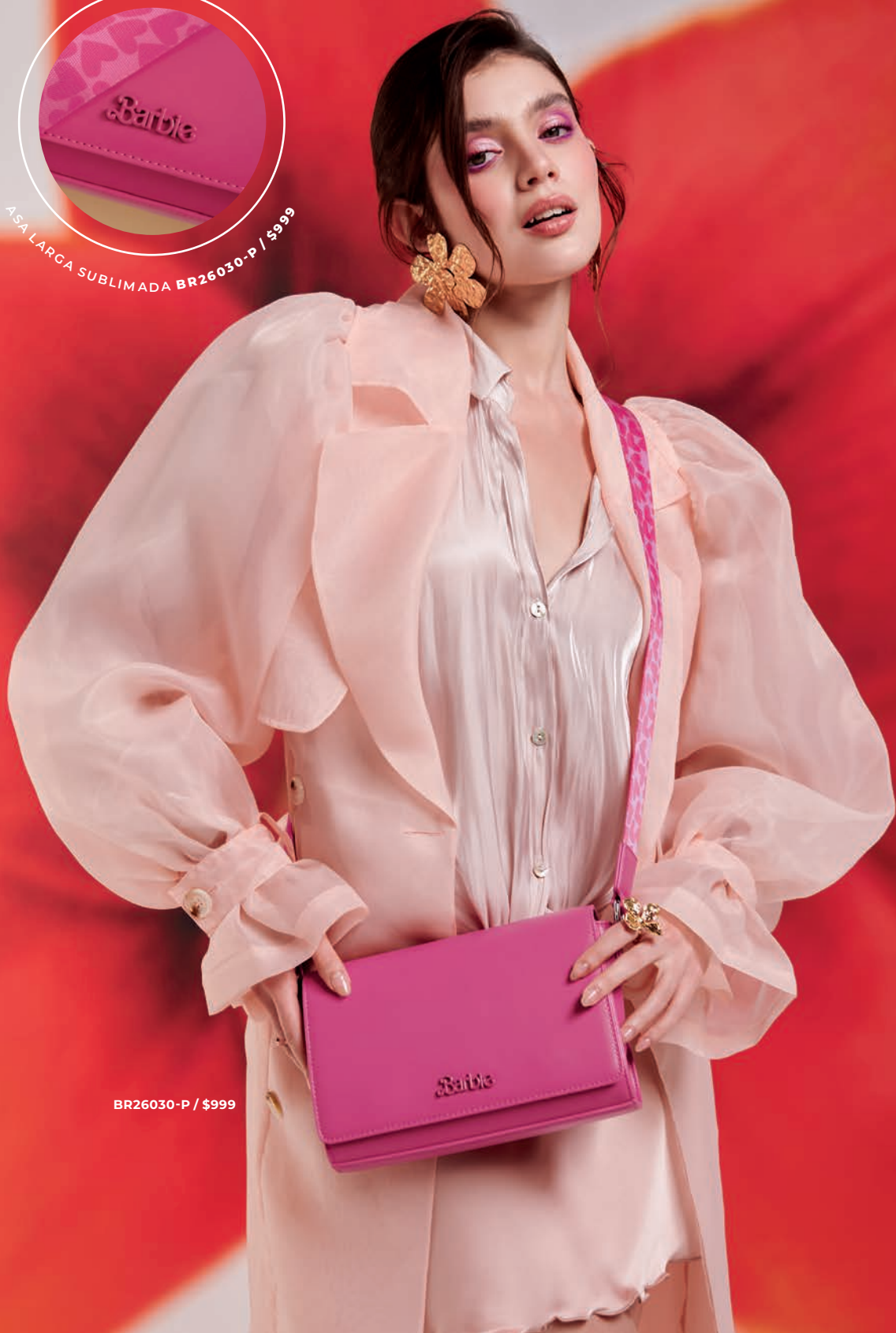
BR26030-P / $999