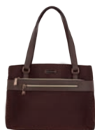
MD25188-D Pag. 29 $599