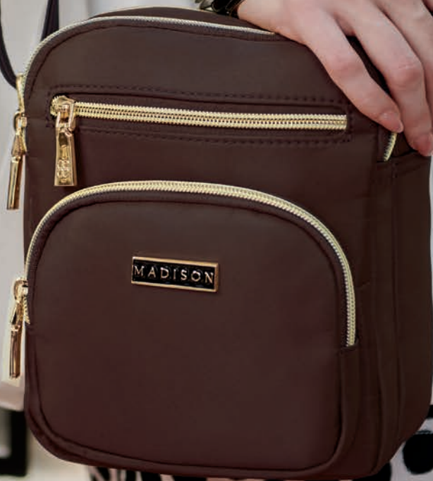
MD25162-D / $449

DOBLE COMPARTIMENTO CON CIERRE MD25162-D / $449