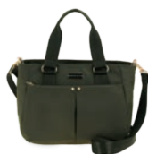
MD25169-A Pag. 12 $699