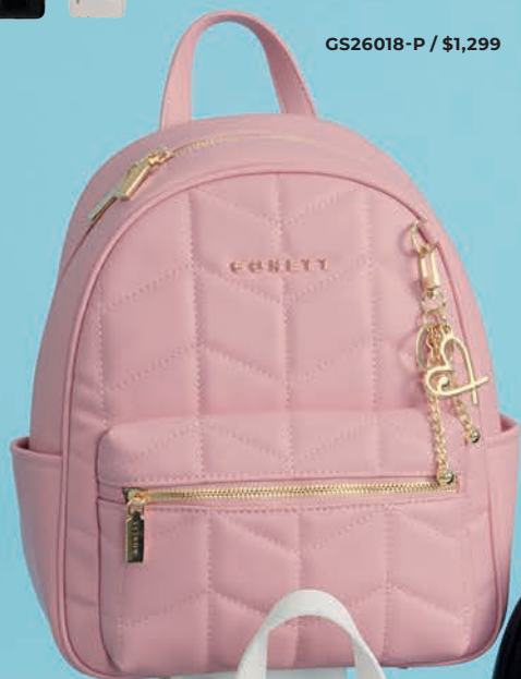
GS26018-P / $1,299