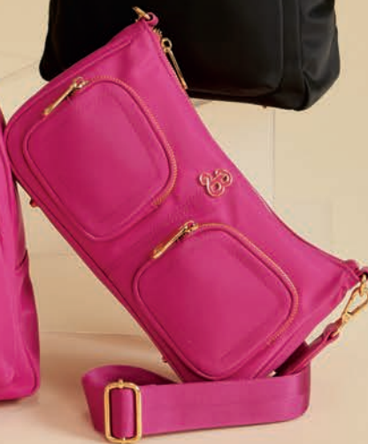
BR26029-P / $999