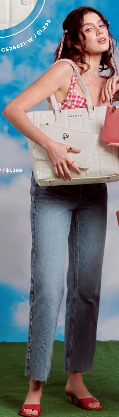
GS26021-W / $1,299