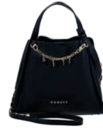
GS26011-3 Pag. 47 $1,299