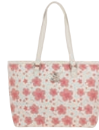
BR26012-W Pag. 95 $1,499