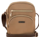
MD25162-B Pag. 37 $449