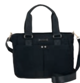
MD25169-3 Pag. 12 $699