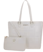
GS26021-W Pag. 66 $1,299