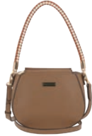
MD25147-B Pag. 43 $499