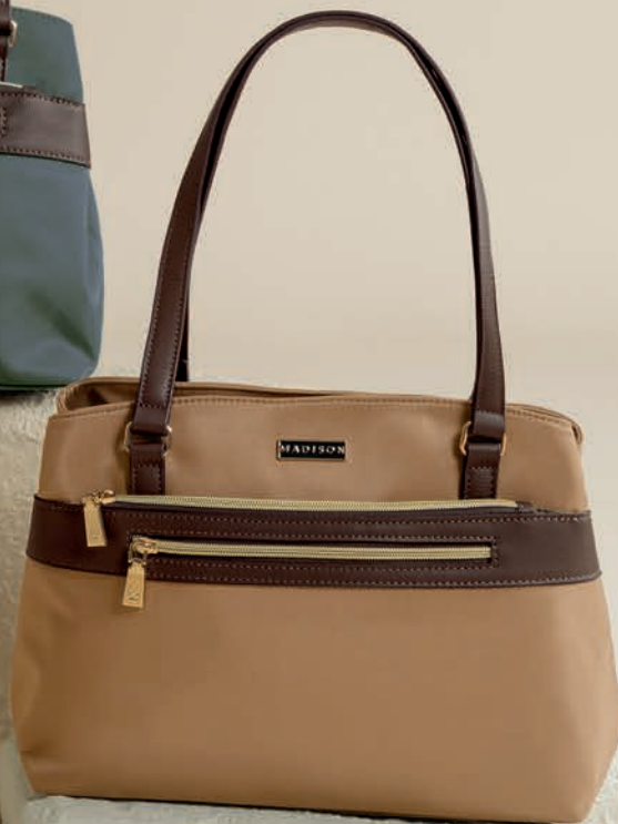
MD25188-B / $599