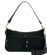
BR26029-3 Pag. 100 $999