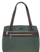
MD25188-2 Pag. 28 $599