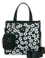
BR26035-3 Pag. 109 $1,299