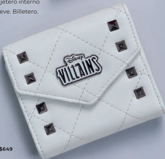
VI26002-W / $649