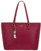
PR26001-M Pag. 121 $1,599