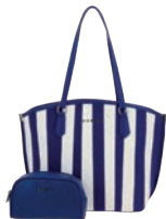
GS26016-9 Pag. 53 $1,199