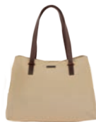
MD25187-8 Pag. 26 $599