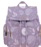
GS26014-V Pag. 50 $1,299