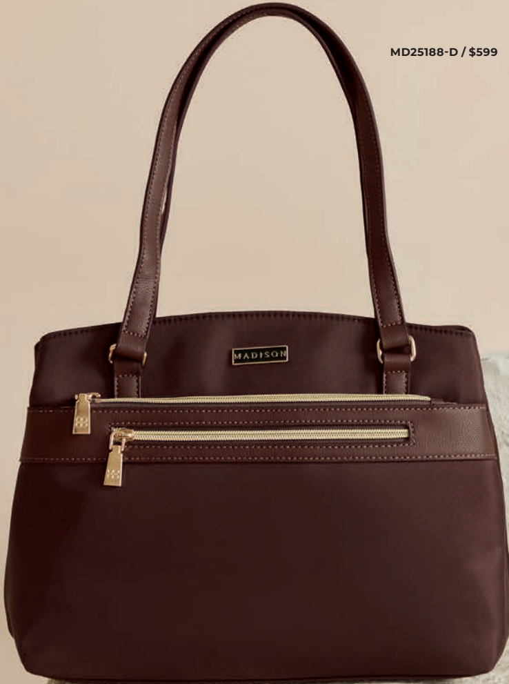
MD25188-D / $599