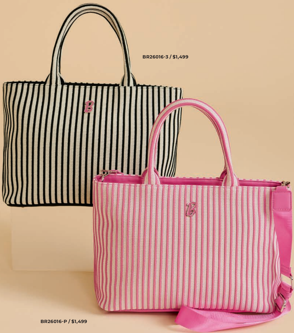
BR26016-3 / $1,499