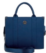
MD26025-9 Pag. 40 $799