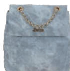
BR26026-9 Pag. 108 $1,499