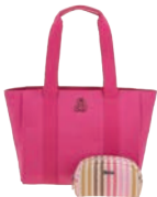
BR26020-P Pag. 99 $1,499