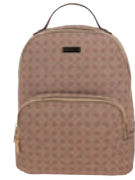
MD25150-P Pag. 19 $699