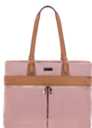
MD25167-P Pag. 7 $899