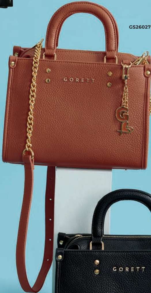
GS26027-B / $1,299