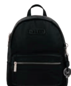
GS26008-3 Pag. 64 $999