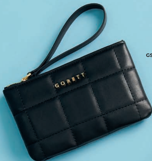
GS26024-3 / $499