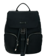
MD25165-3 Pag. 9 $999