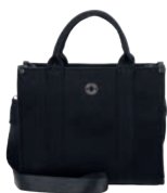
MD26025-3 Pag. 40 $799