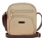
MD25162-8 Pag. 38 $449