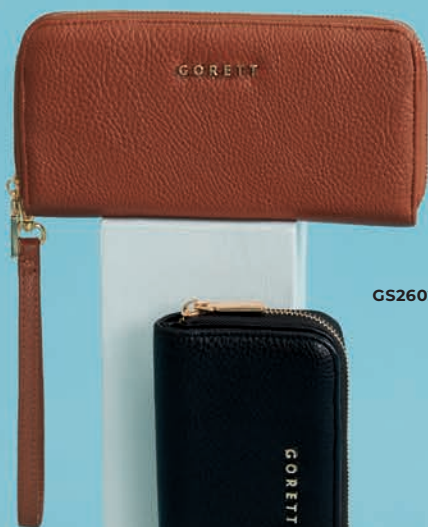
GS26029-3 / $599