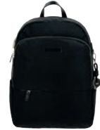
GS26004-3 Pag. 49 $1,399