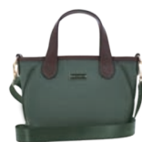
MD25193-2 Pag. 31 $499