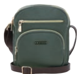
MD25162-2 Pag. 37 $449