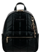
GS26018-3 Pag. 54 $1,299