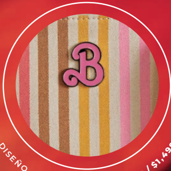
DISEÑO SUBLIMADO BR26020-C / $1,499