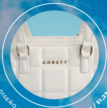
DISEÑO CAPITONADO GS26021-W / $1,299