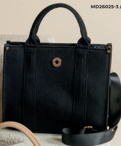
MD26025-3 / $799