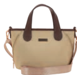
MD25193-8 Pag. 32 $499