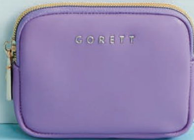
GS26035-V / $499