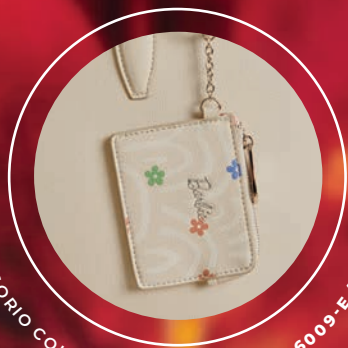
ACCESORIO COLGANTE REMOVIBLE BR26009-E / $1,499