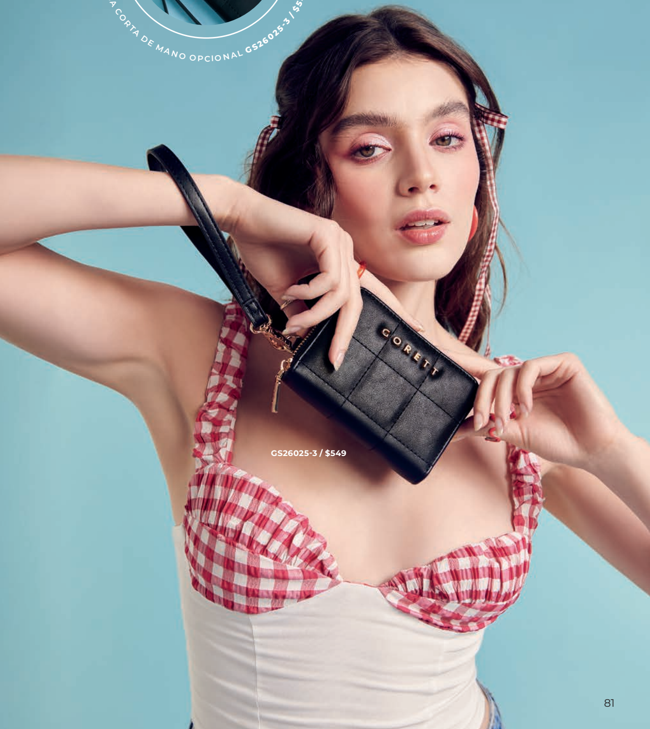
GS26025-3 / $549