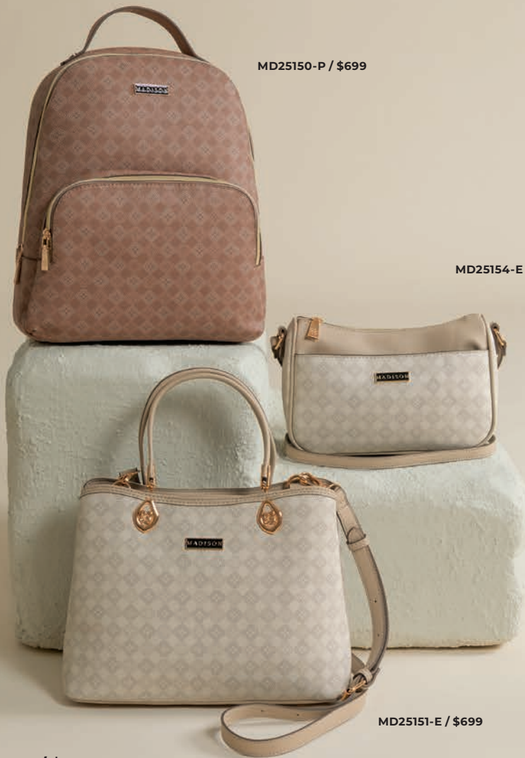
MD25150-P / $699