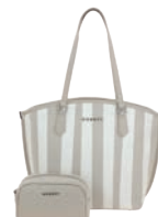
GS26016-E Pag. 53 $1,199