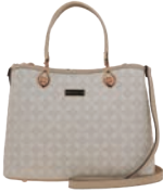
MD25151-E Pag. 19 $699