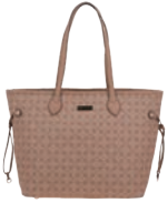
MD25148-P Pag. 18 $699