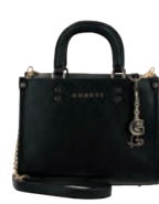
GS26027-3 Pag. 71 $1,299