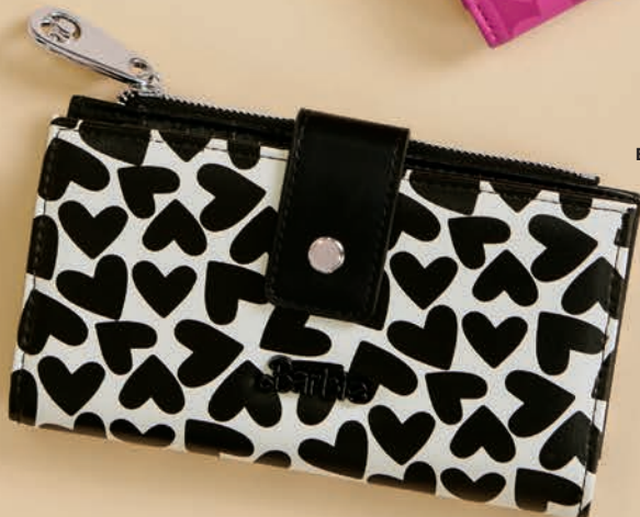
BR26031-3 / $649