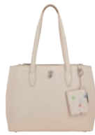
BR26009-E Pag. 91 $1,499