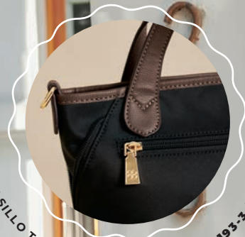
BOLSILLO TRASERO CON CIERRE MD25193-3 / $499