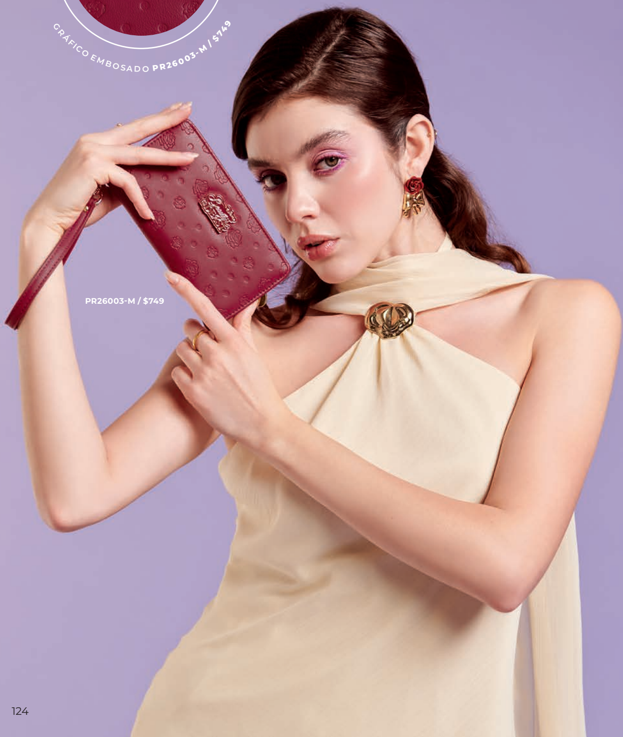
PR26003-M / $749