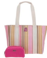
BR26020-C Pag. 99 $1,499