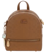
PR26002-B Pag. 121 $1,299