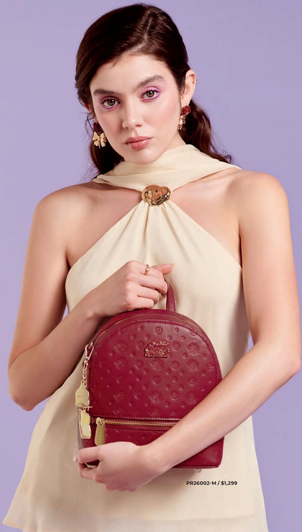
PR26002-M / $1,299