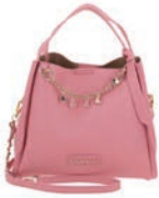
GS26011-P Pag. 47 $1,299