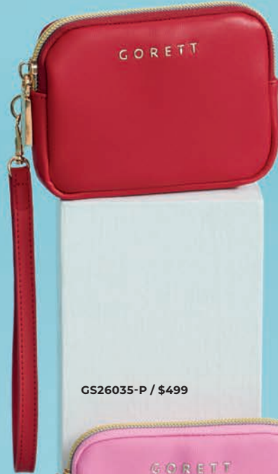
GS26035-P / $499