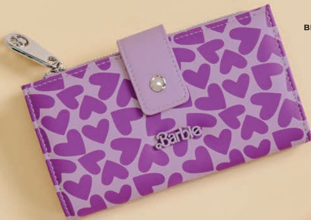
BR26031-V / $649