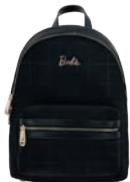
BR26032-3 Pag. 101 $1,399