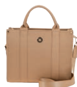
MD26025-E Pag. 40 $799