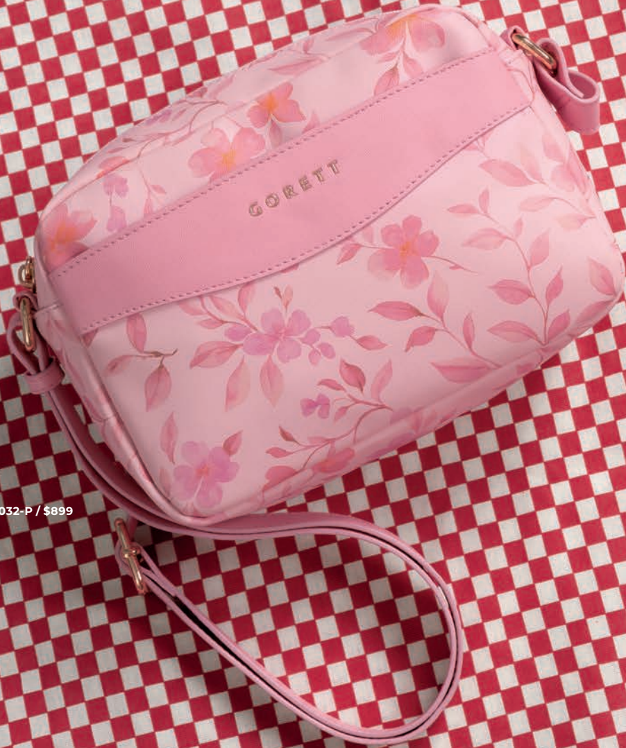
GS26032-P / $899