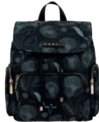
GS26014-3 Pag. 50 $1,299