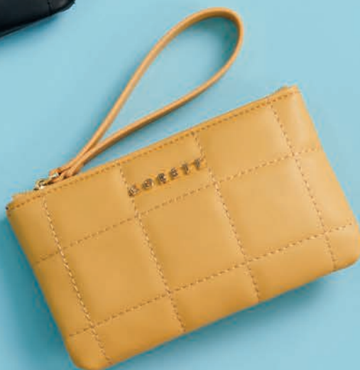
GS26024-L / $499