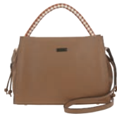
MD25145-B Pag. 41 $699