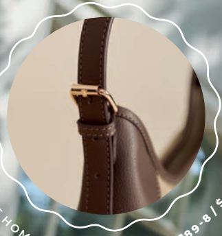
ASA DE HOMBRO AJUSTABLE MD25189-8 / $499