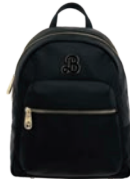
BR26028-3 Pag. 100 $1,399