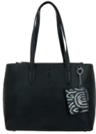
BR26009-3 Pag. 91 $1,499