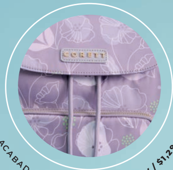
ACABADO SUBLIMADO GS26014-V / $1,299