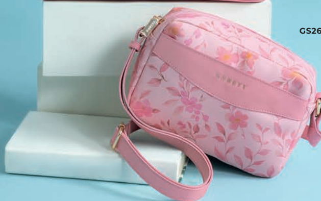
GS26032-P / $899