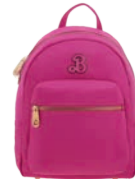
BR26028-P Pag. 100 $1,399