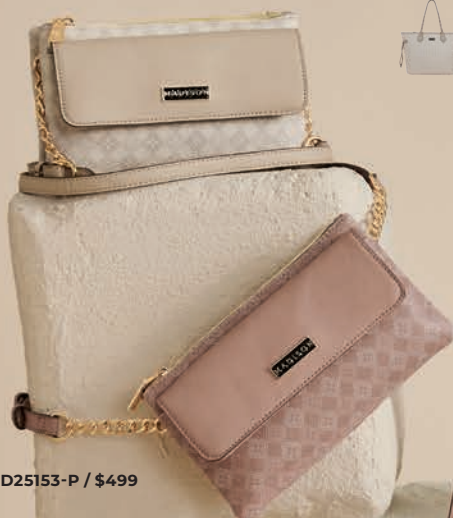
MD25153-P / $499