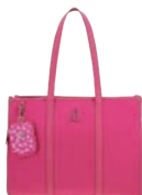
BR26034-P Pag. 109 $1,499