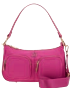
BR26029-P Pag. 100 $999