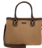
MD25186-B Pag. 24 $599