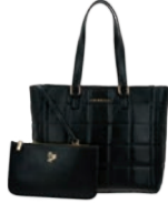
GS26021-3 Pag. 66 $1,299