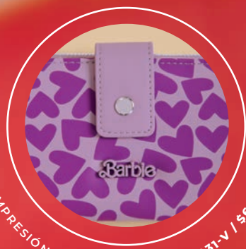
IMPRESIÓN DE SERIGRAFÍA BR26031-V / $649