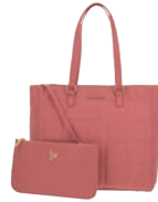
GS26021-P Pag. 66 $1,299