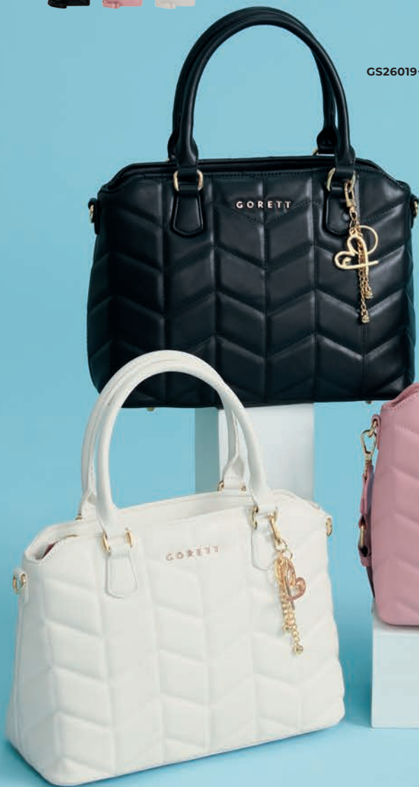
GS26019-3 / $1,299