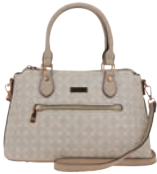
MD25152-E Pag. 20 $699