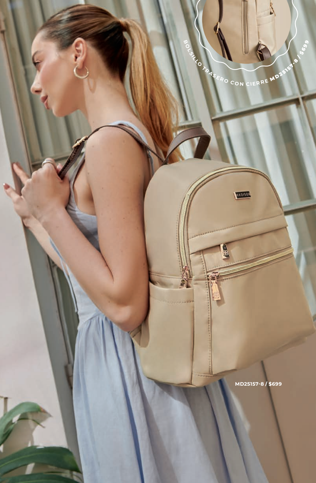
MD25157-8 / $699