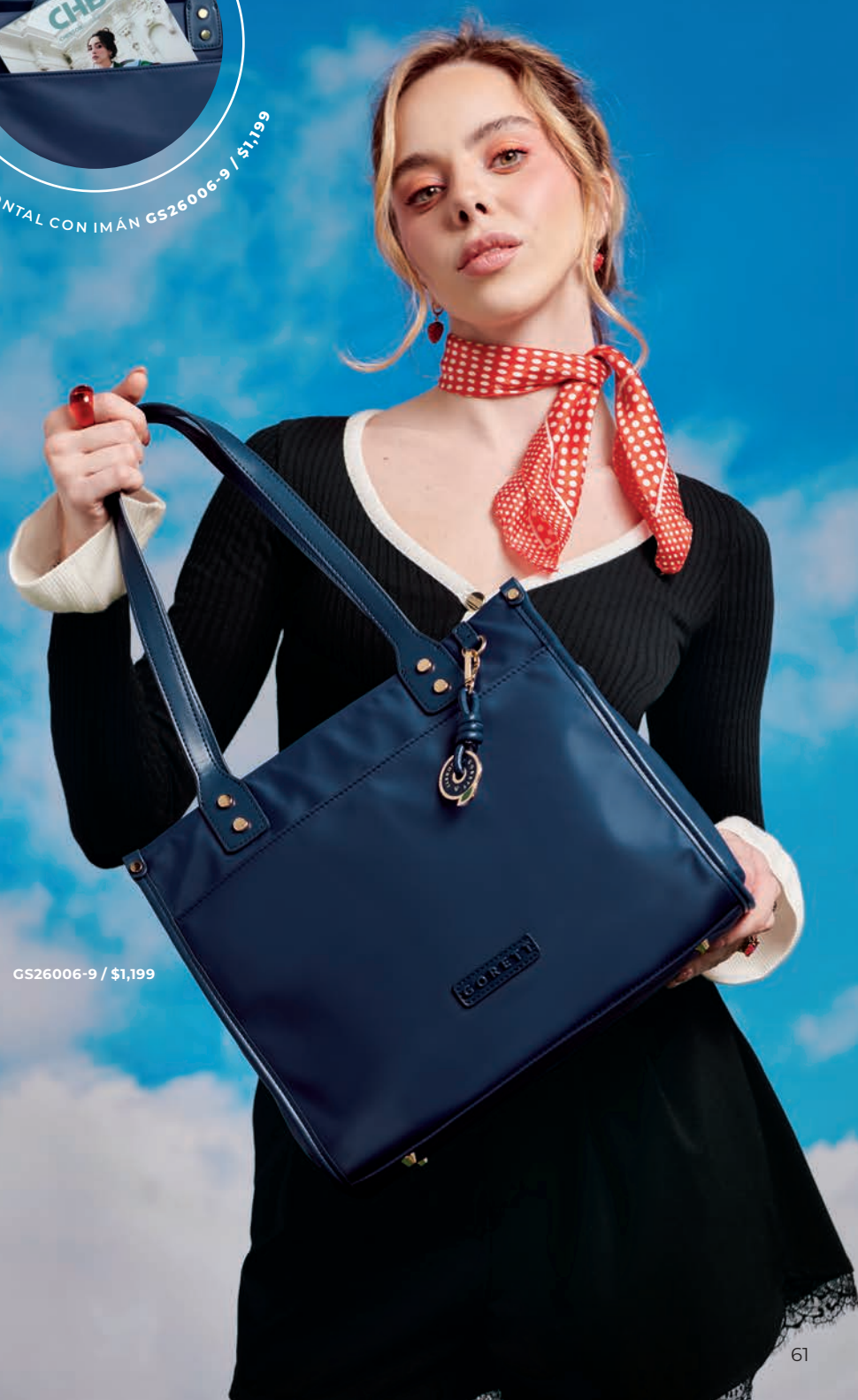
GS26006-9 / $1,199