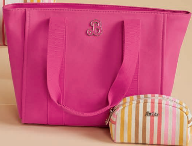
BR26020-P / $1,499