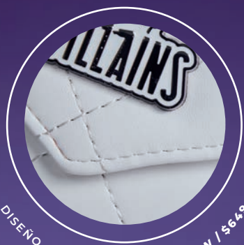
DISEÑO CAPITONADO VI26002-W / $649