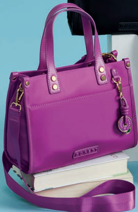
GS26009-F / $999