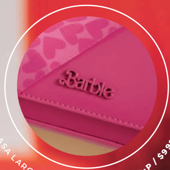
ASA LARCA SUBLIMADA BR26030-P / $999