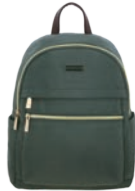
MD25157-2 Pag. 21 $699