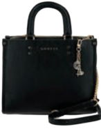
GS26026-3 Pag. 70 $1,399