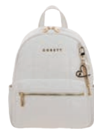
GS26018-W Pag. 54 $1,299