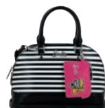
BR26007-3 Pag. 104 $1,299