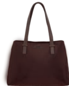
MD25187-D Pag. 26 $599