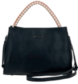
MD25145-3 Pag. 41 $699