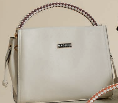
MD25146-E / $599