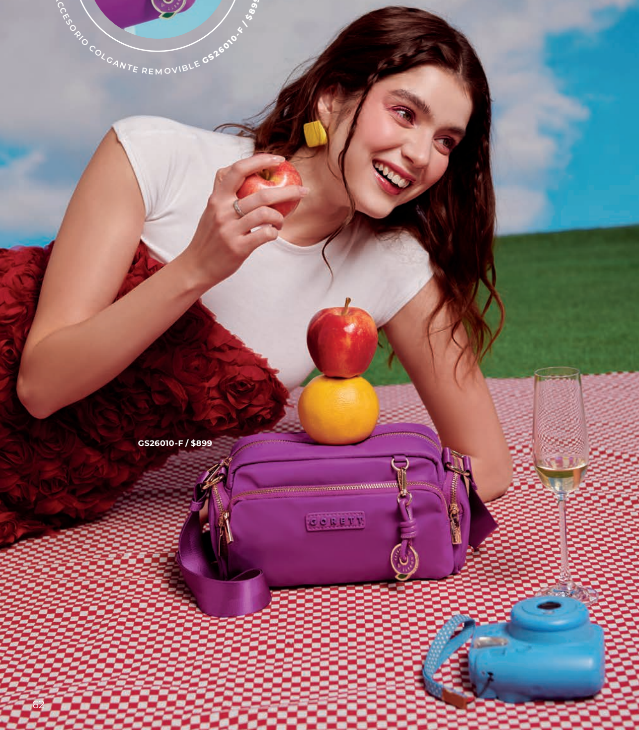
GS26010-F / $899