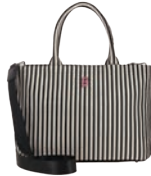
BR26016-3 Pag. 96 $1,499