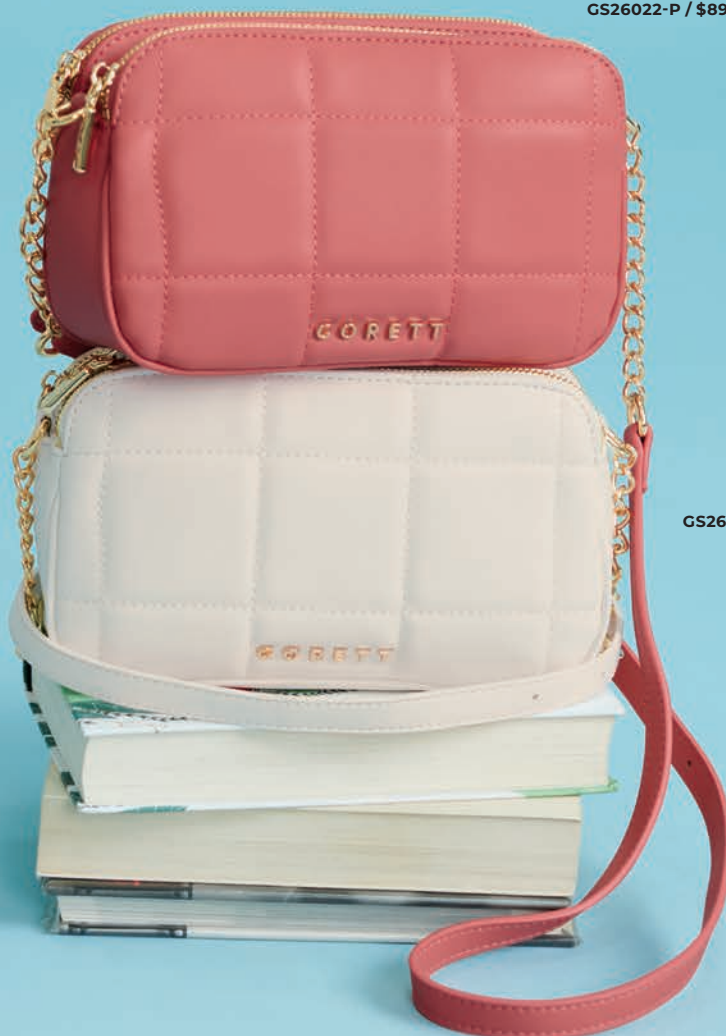
GS26022-W / $899