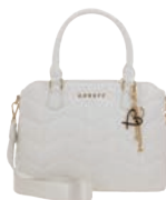
GS26019-W Pag. 55 $1,299