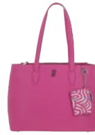
BR26009-P Pag. 91 $1,499