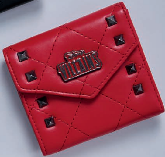
VI26002-R / $649