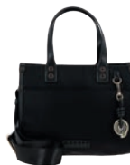
GS26009-3 Pag. 65 $999