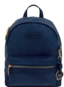
GS26008-9 Pag. 64 $999