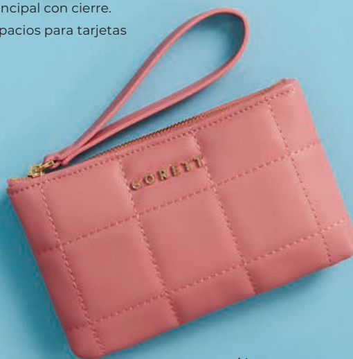
GS26024-P / $499