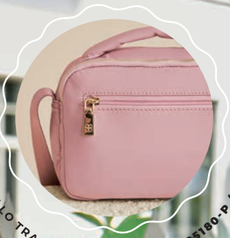
BOLSILLO TRASERO CON CIERRE MD25180-P | $499