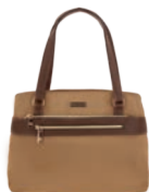
MD25188-B Pag. 28 $599