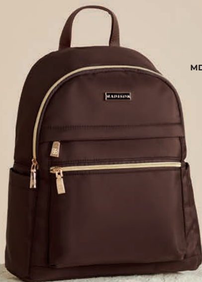
MD25157-D / $699