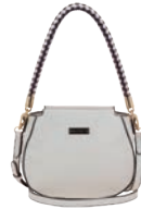
MD25147-E Pag. 43 $499