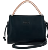
MD25146-3 Pag. 42 $599