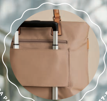
BANDA PARA BASTÓN DE MALETA MD25167-8 / $899