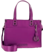
GS26009-F Pag. 65 $999