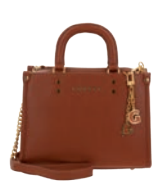
GS26027-B Pag. 71 $1,299