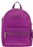
GS26008-F Pag. 64 $999