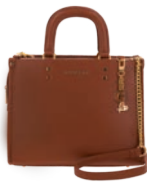
GS26026-B Pag. 70 $1,399