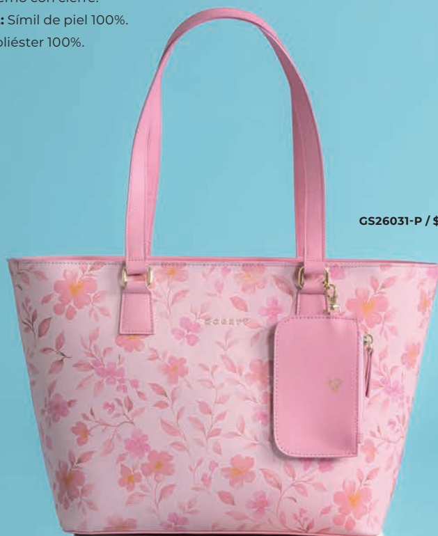
GS26031-P / $1,399