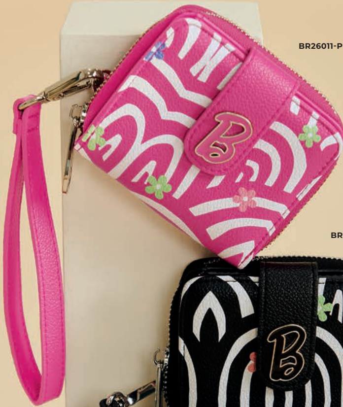
BR26011-P / $599