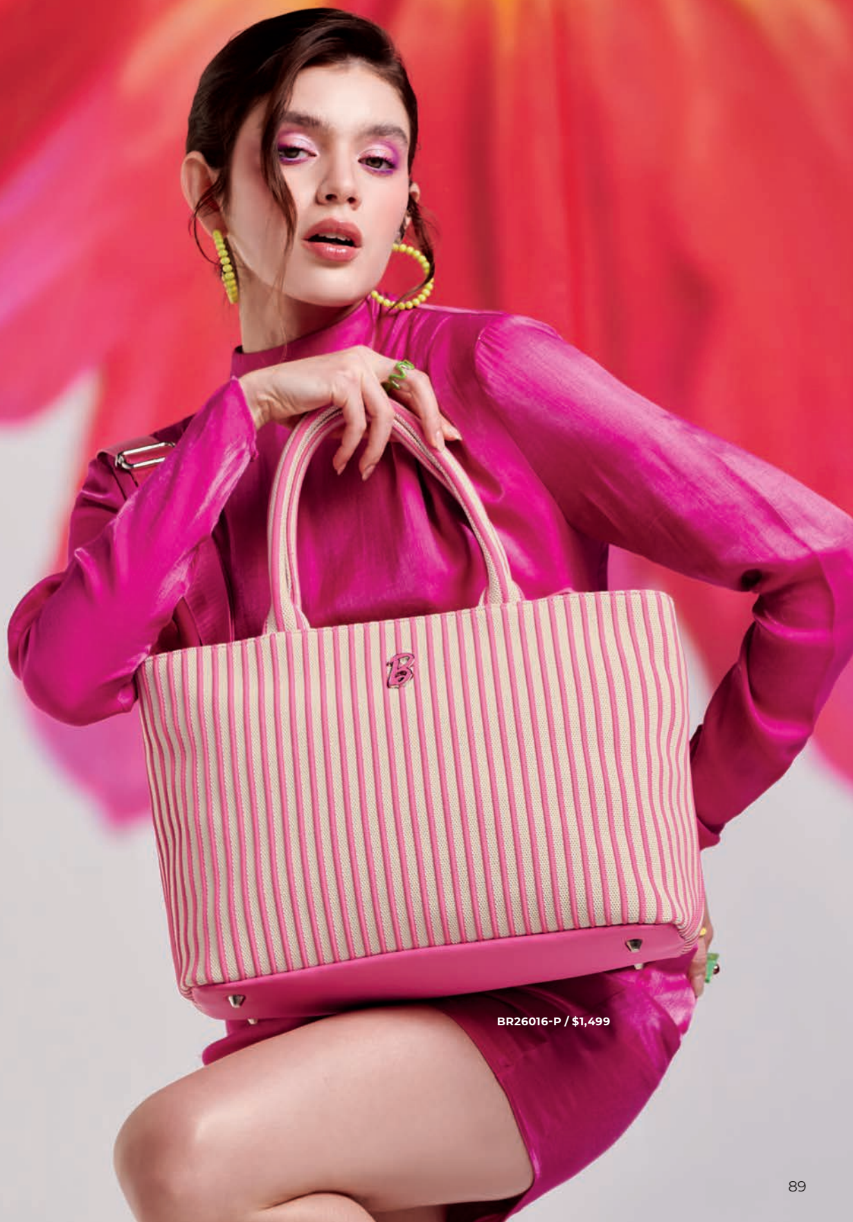
BR26016-P / $1,499