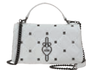
VI26001-W Pag. 129 $1,299