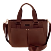
MD25169-B Pag. 12 $699