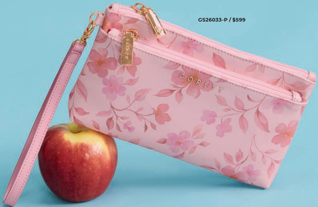
GS26033-P / $599